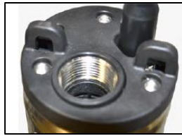
1" rst liitäntä